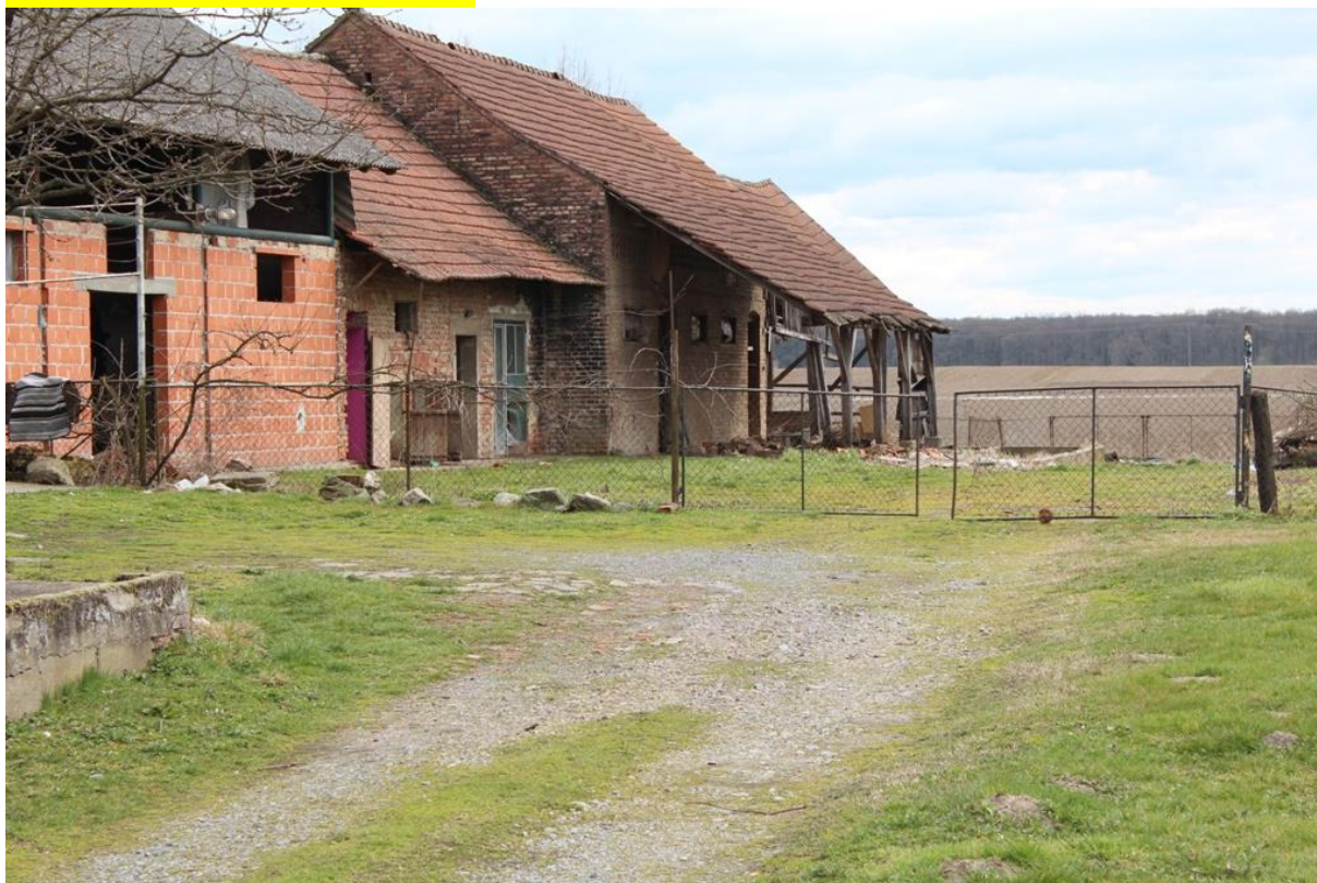
SLIKA NEKRETNINE U MEĐURIĆU: